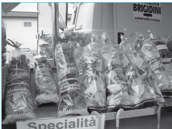
I brigidini, un nostro biglietto da visita su tutte le piazze della toscana... e non solo!

È una realtà frenetica, difficile per cultura, anche se si sono