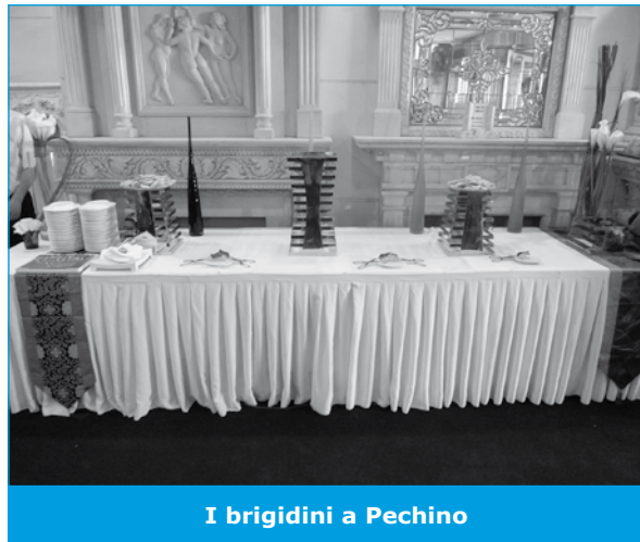
I brigidini a Pechino

Bisogna muoversi con criterio seguendo alcuni passi fondamentali, primo fra tutti, la registrazione del marchio, perché riescono a copiarlo in men che non si dica, e per le imprese più piccole è consigliabile riunirsi in gruppi in modo da limitare i costi delle presentazioni.