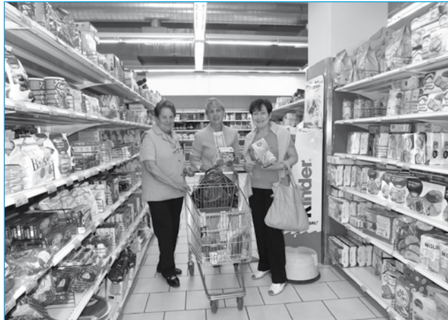
Un momento della spesa guidata alla COOP di Larciano

Il terzo incontro, svoltosi presso la Coop di Larciano , ha previsto una simulazione di una spesa guidata; i partecipanti, suddivisi in piccoli gruppi, avevano il compito di preparare pasti equilibrati da un punto di vista nutrizionale, adeguati ai vari momenti della giornata (colazione, pranzo, cena). Al termine della spesa è seguito un confronto sulle scelte effettuate dai consumatori e, come per ogni altro appuntamento, una salutare merenda offerta dalla Coop di Larciano. I partecipanti sono stati inoltre invitati a presentare delle loro ricette da condividere con gli altri. L'importanza di una sana alimentazione basata su cibi naturali, completi dal punto di vista nutritivo e correttamente associati, risulta evidente per