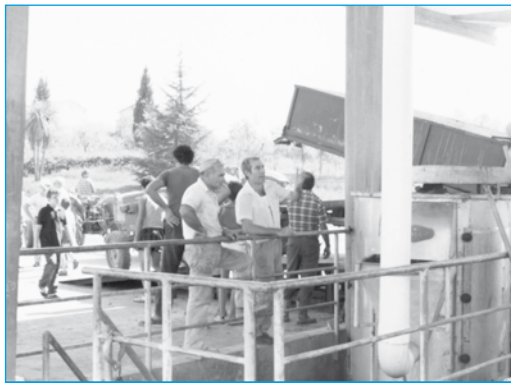
L'uva viene portata alla cantina...