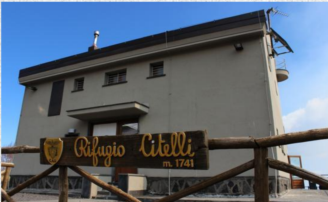
Fig. 4 Rifugio Citelli