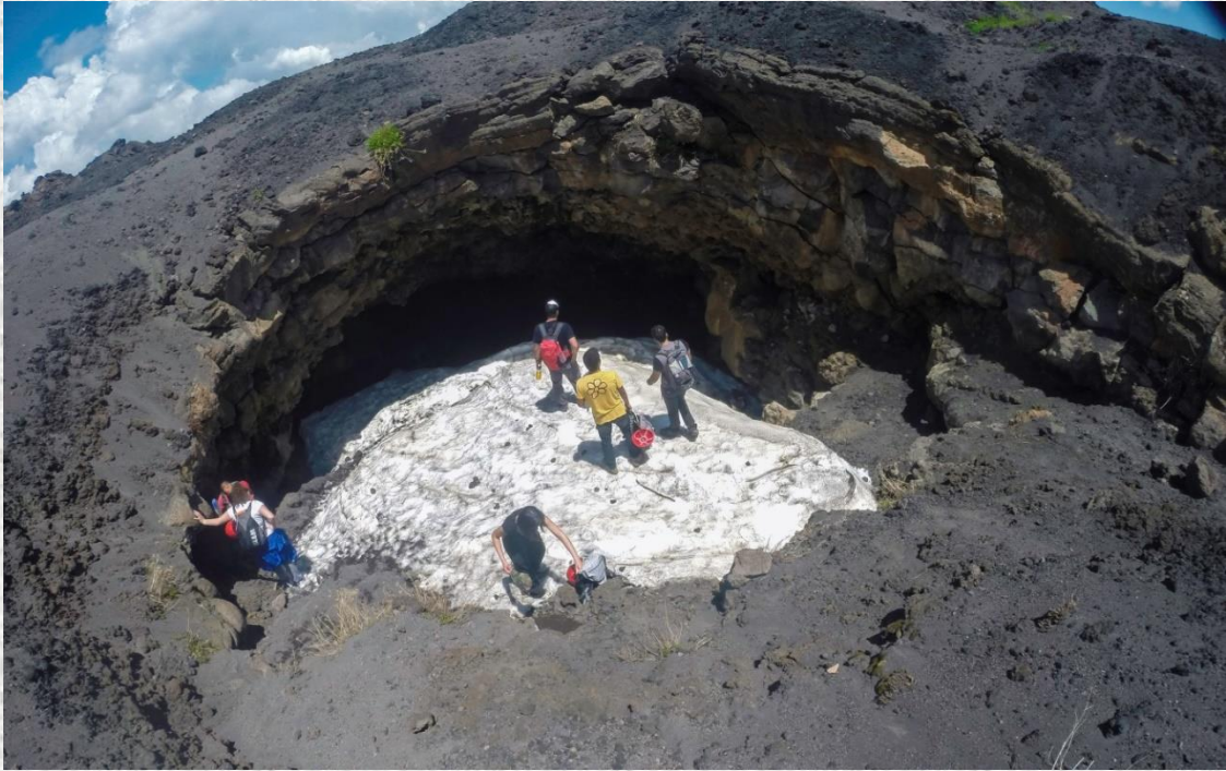
Fig.3 Grotta lavica del Gelo