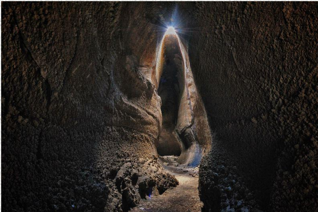
Fig.2 Grotta lavica di Serracozzo