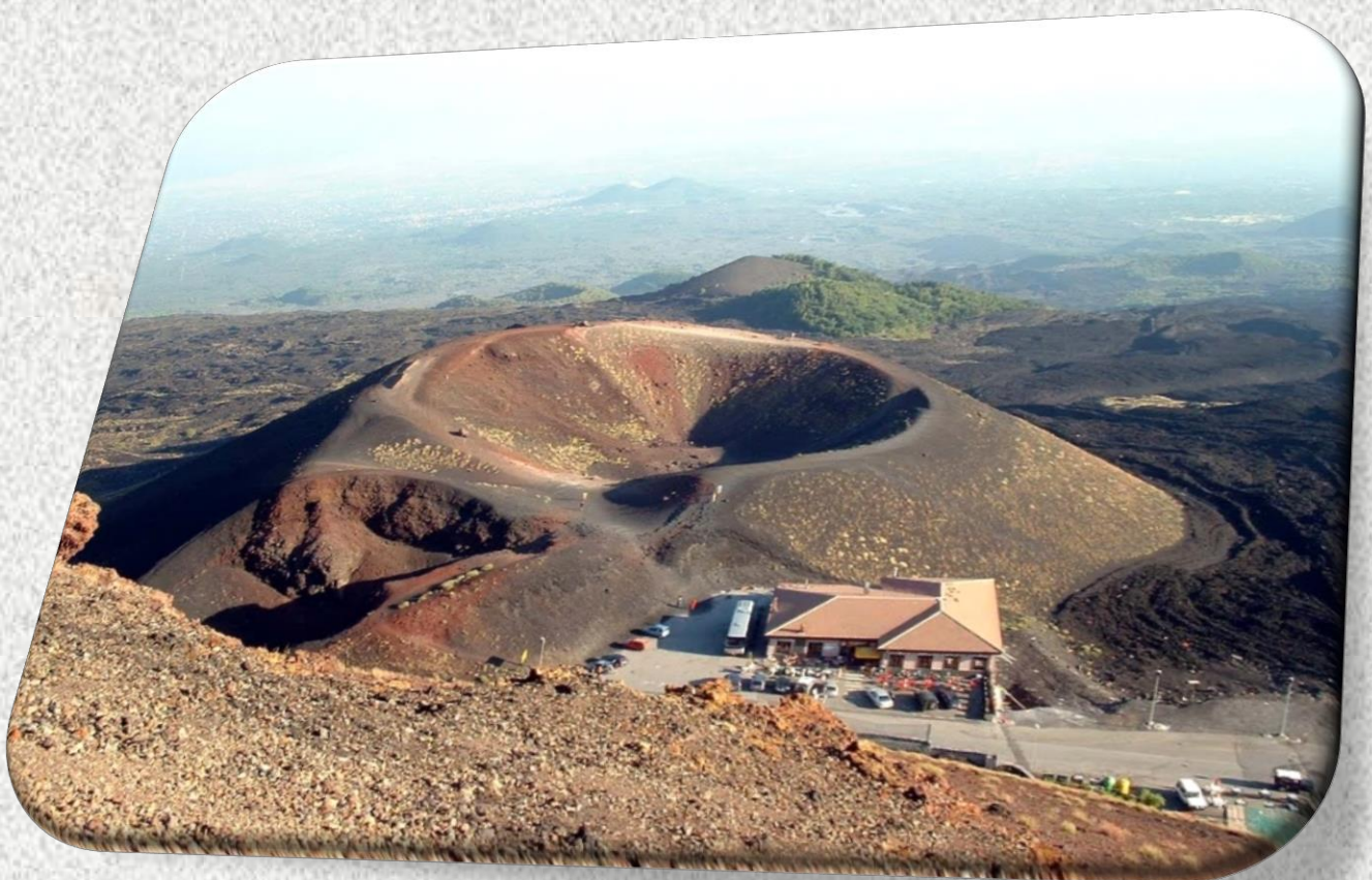
Fig. 6 Rifugio Sapienza