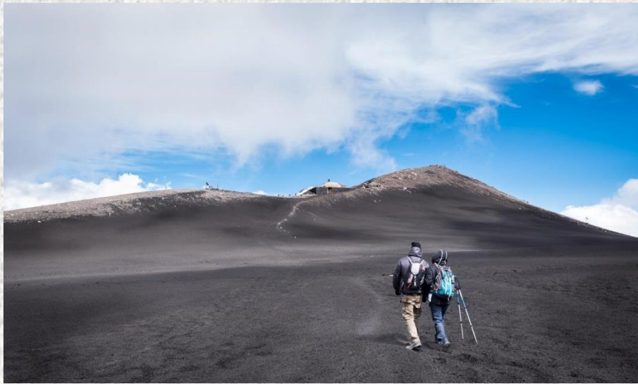
Fig. 5 Piano Provenzana