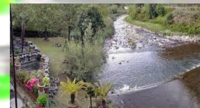
SAN LORENZO & SANTA CATERINA