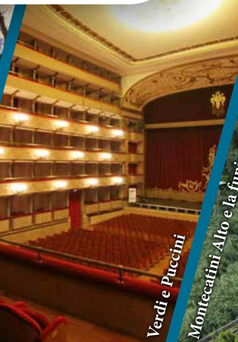
Verdi e Puccini