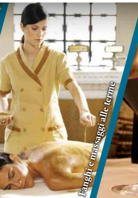
Fanghi e massaggi alle terme