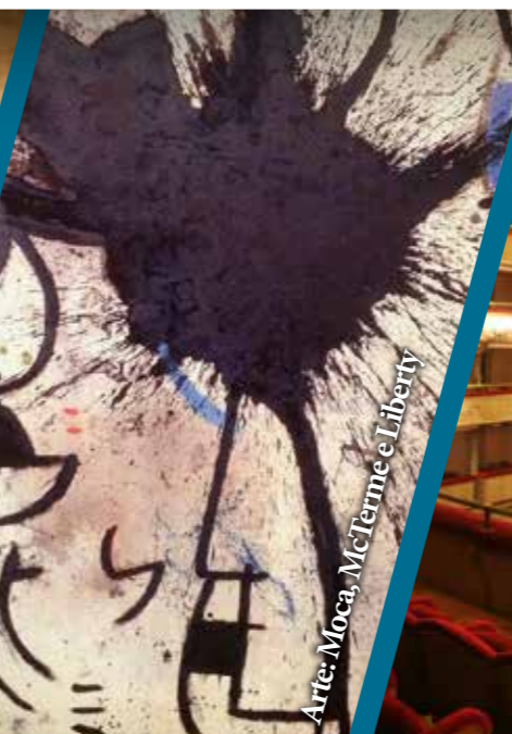
Arte: Moca, McTerme e Liberty