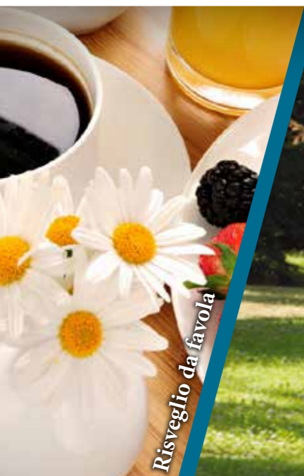
Risveglio da favola