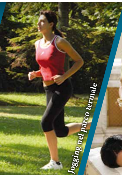
Jogging nel parco termale