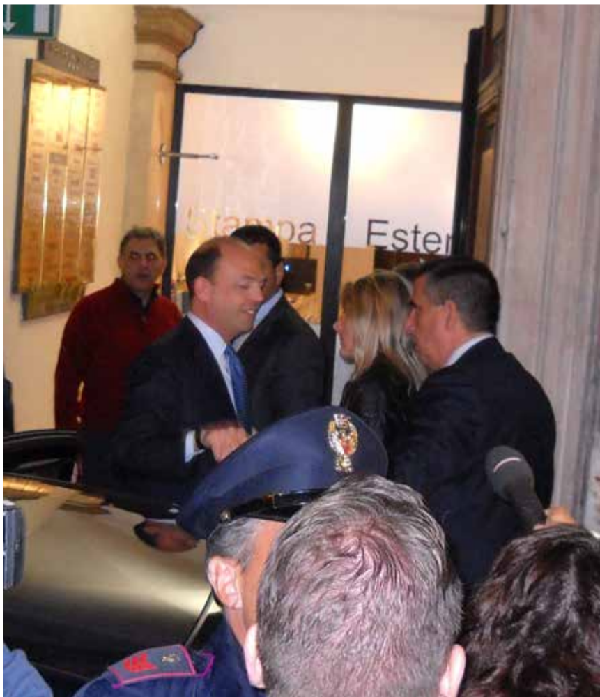
MESE era presente a Roma il 16 novembre u. s. alla Conferenza Stampa di Angelino Alfano che ha sancito la fine del PDL: una data storica?