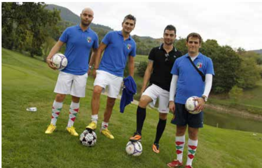
LA SQUADRA DEL SIENA FOOTGOLF

"Abbiamo molti progetti per il 2014, tra i quali conquistare sempre più golf club, cercando di poter avere buche da FootGolf permanenti nei loro percorsi. Questo per dare la possibilità ai FootGolfers di allenarsi regolarmente in strutture vicine a loro, passo fondamentale per alzare il livello tecnico della nostra nazione e poter competere maggiormente con gli altri paesi".