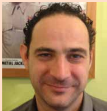
di VITO GENINA

Come sempre in questo numero di mese sono stati trattati diversi argomenti che hanno fatto parlare nei giorni scorsi.