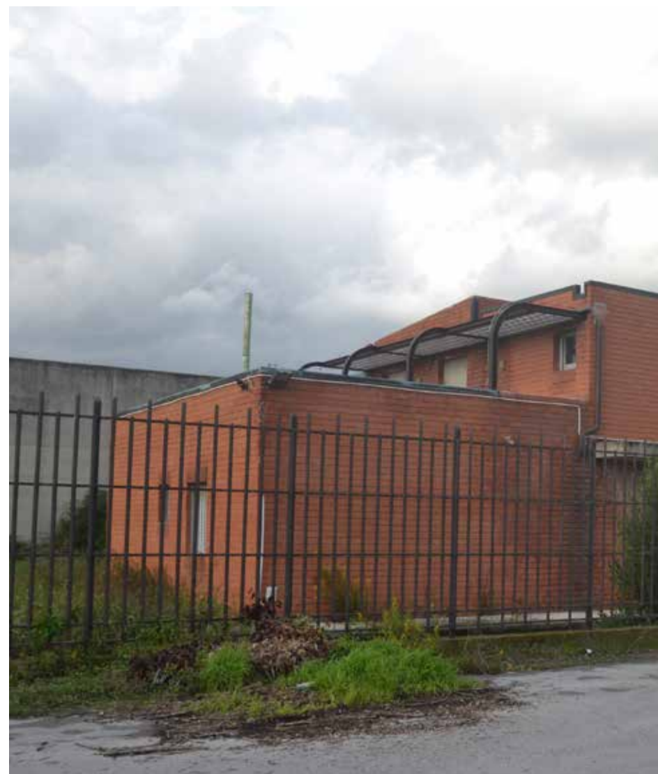
FOTO DELLO STATO ATTUALE