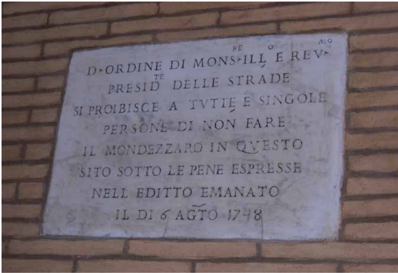
Forse sarebbe il caso di ricominciare ad appendere lapidi simili?