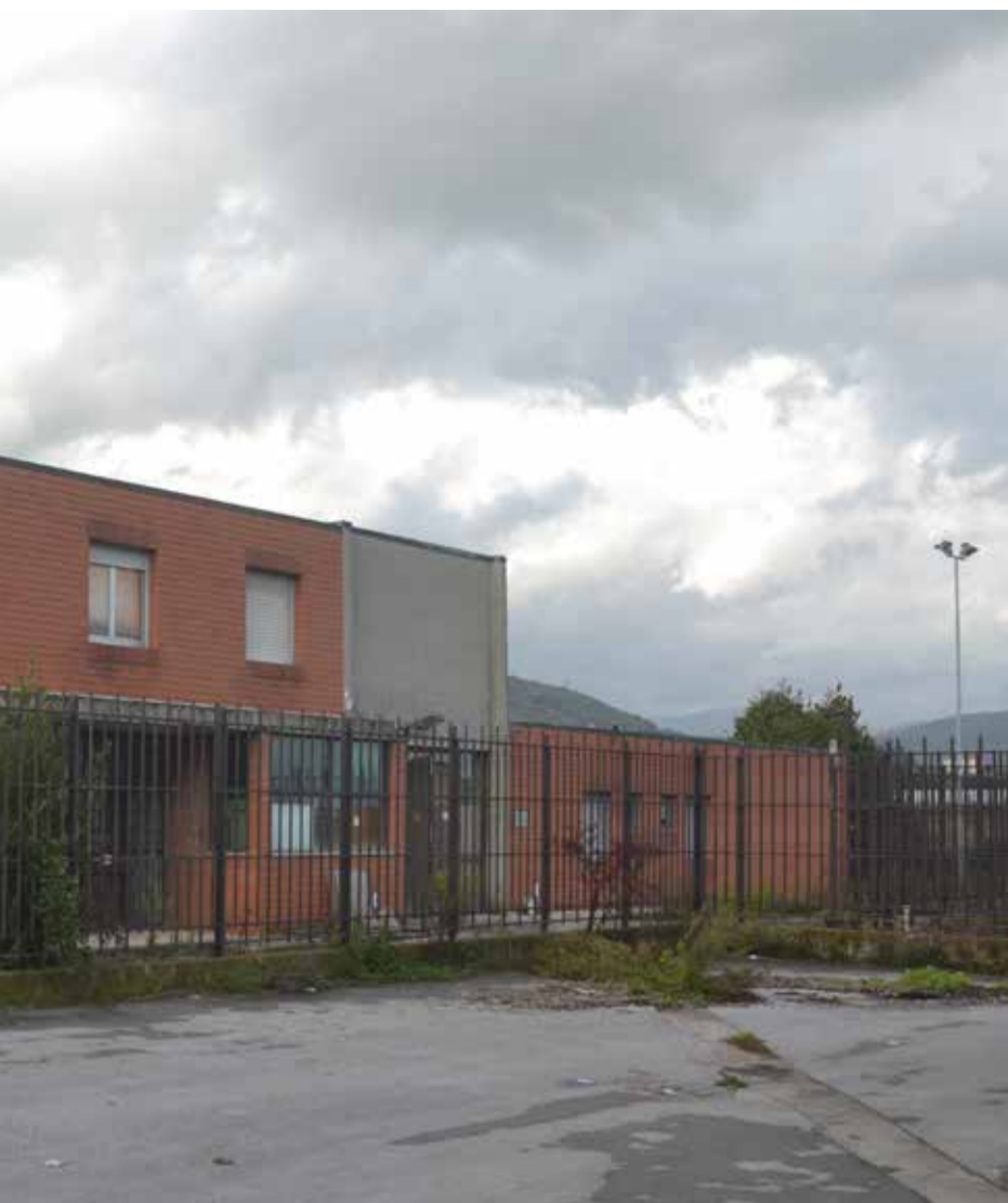
LE DEL CARCERE DI VENERI