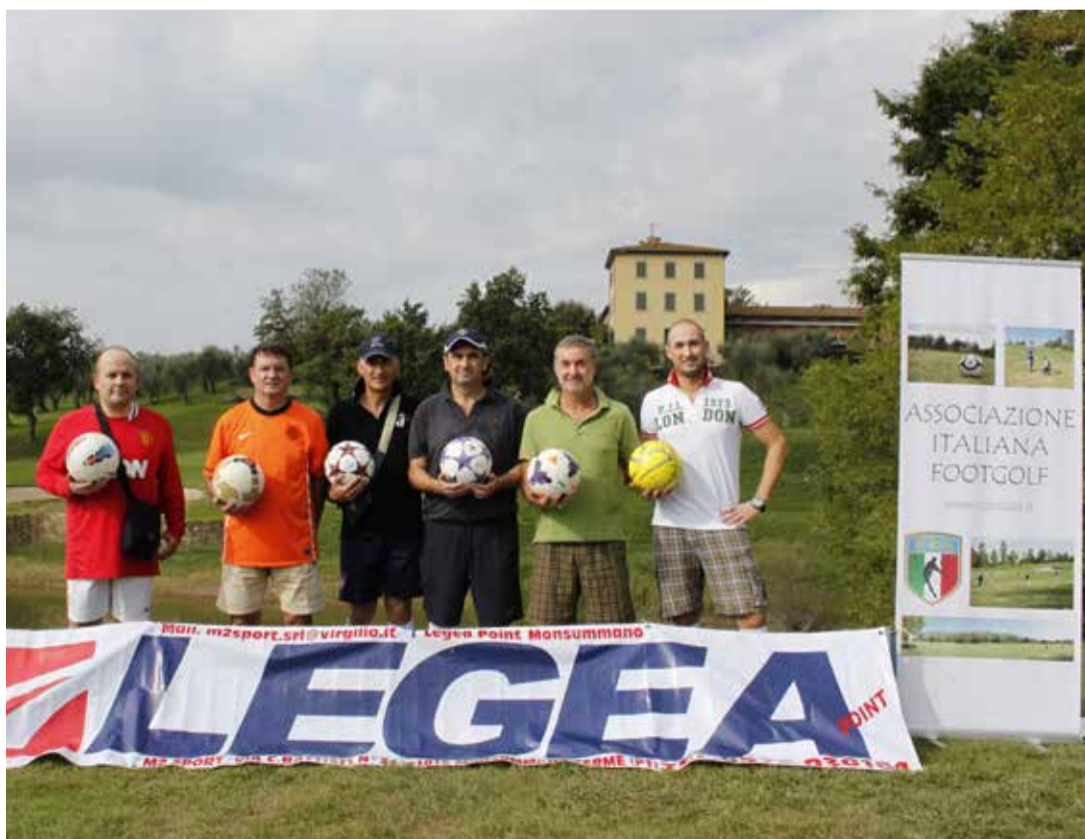
ATLETI MONTECATINESI IN POSA ALLA PARTENZA DELLE BUCA 1

Inoltre il prossimo anno partirà il primo campionato nazionale, con tappe (si parla di una quindicina di appuntamenti almeno) prestabilite in tutta la penisola. Una di queste tappe sarà sicuramente a Montecatini.