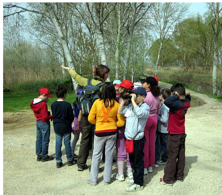
VISITA NATURALISTICA DELL'AREA PROTETTA

E ce n'è davvero per tutti i gusti. Si parte con percorsi che hanno come argomento la storia del padule, le modifiche dell'uomo (le bonifiche dei Medici e dei Lorena) o le visite alle emergenze storico architettoniche rimaste (Ponte di Cappiano, dogana, l'essiccatoio del tabacco) fino ad arrivare ai laboratori sulle attività tradizionali come la lavorazione del-