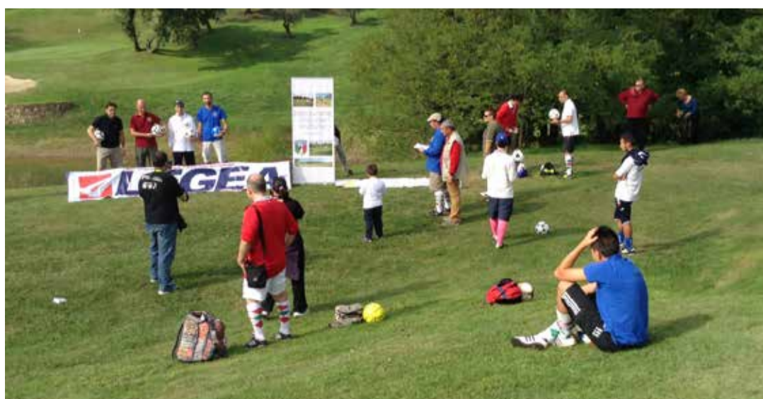
GIOCATORI E PUBBLICO ALLA PARTENZA DELLA BUCA 1