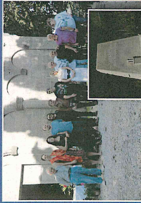
Monumento Al Sommergebile Scire Dino Centini