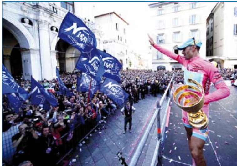
Brescia - 26 maggio 2013, i "CanNibali" invadono la città Vincenzo ha il 96° Giro d'Italia

C'è una gara a tappe riservata alla categoria Juniores che è soprannominata "Il piccolo Tour de France" per il semplice motivo che a correrlo ogni anno ci sono le più belle promesse del ciclismo giovanile mondiale. Nell'edizione del 2002 vi prese parte anche il campione italiano in carica con grandi aspirazioni di vittoria proprio in ragione della maglia tricolore che indossava e per gli importanti e numerosi successi che aveva già riportato nel corso di quella stagione. Era un caldo pomeriggio di fine estate ed un ragazzino di Mastromarco "condannato" fin da piccolo a vivere le corse, ritagliò un vecchio oramai liso lenzuolo e con un barattolo di vernice avanzata ci scrisse sopra "CanNibali". Il giorno successivo, insieme ai soliti "fissati" del paese era sulle tortuose stradine della Lunigiana a fare il tifo per un altro ragazzo, poco più grande di lui, che con la maglia tricolore addosso, vinse ancora. E insieme si fecero una foto, loro due, i ragazzi e una decina di tifosi incalliti a cui bastava sentire il rumore dei raggi per sentirsi bene ma che tutte le volte che vinceva un Maestromarcano si sentivano ancora meglio. Davanti a loro in quella foto datata campeggia il pezzo del lenzuolo in disuso che segnò la nascita del fan Club oggi definito con enfasi "il migliore del mondo", certamente quello più in voga in questo momento. Ma "I CanNibali" non sono un Fan Club, sono una specie di famiglia allargata nella quale