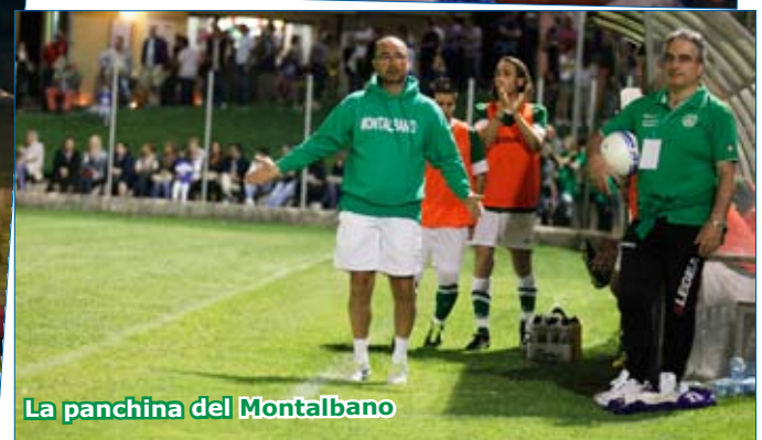
La panchina del Montalbano