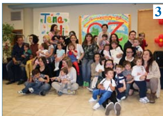
1) Foto di gruppo Cantiamo insieme 2) Foto di gruppo festa di Carnevale 3) Foto di gruppo spettacolo Il mago di Oz

mati "Pop uP", ovvero quei testi con le pagine con immagini colorate e tridimensionali. E la lettura di ogni libro è stata l'occasione per un'attività grafica o manipolativa presentata sempre sotto forma di gioco! E giocando i bambini imparano il rispetto degli altri e delle cose.