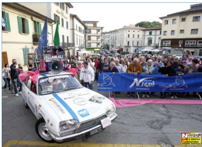
1 giugno 2013: Vincenzo Nibali arriva in piazza del Comune a Lamporecchio, la macchina è quella di Ciorci ... che la festa inizi!

Spaghetti e brostin- ciane, gags e discor- si, canzoni e poesie e poi sorrisi, pianti e pacche sulle spalle, in altre parole vita.