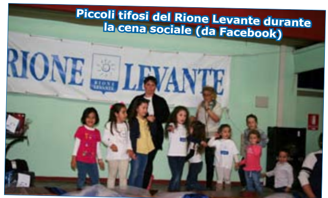
Piccoli tifosi del Rione Levante durante la cena sociale

Le foto del Torneo dei Rioni sono disponibili da Foto Nucci via Verdi n. 29 a Lamporecchio (PT)