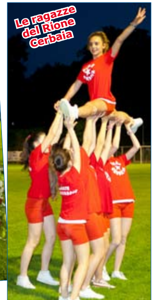
Le ragazze del Rione Cerbaia