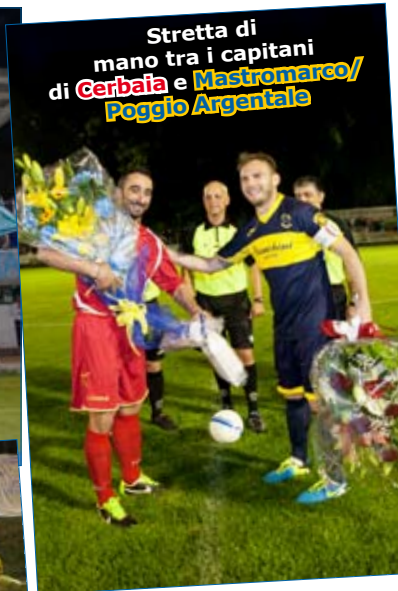
Stretta di mano tra i capitani di Cerbaia e Mastromarco/Poggio Argentario