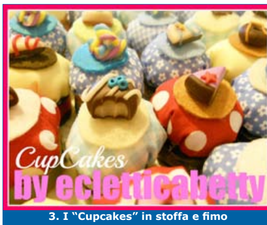
3. I “Cupcakes” in stoffa e fimo

Nonostante la famiglia, la sua bambina, il lavoro e