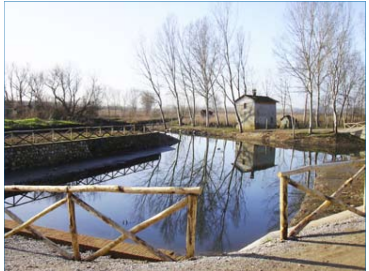
Il "Porto de Le Morette"