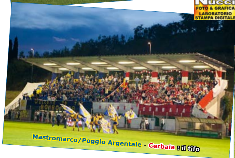
Mastromarco/Poggio Argentario - Cerbaia : il tifo