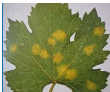
Una foglia colpita dalla Peronospora