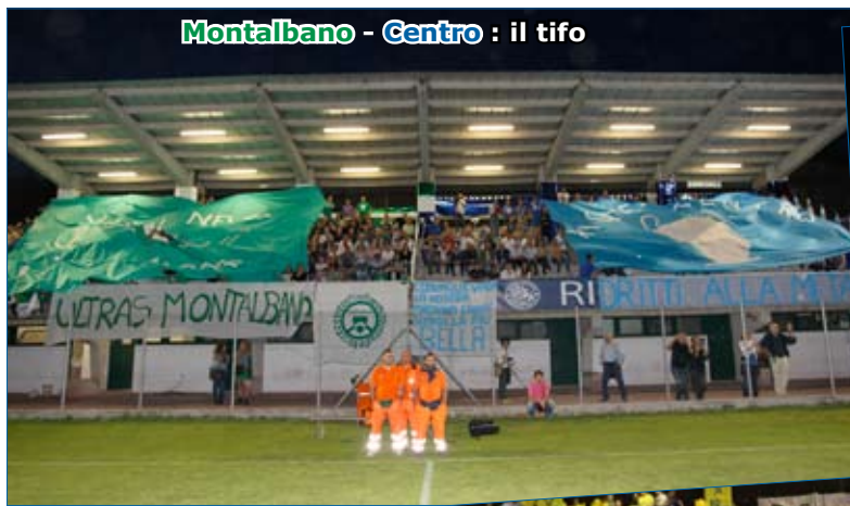
Montalbano - Centro : il tifo