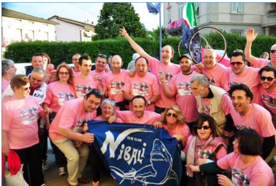
Anche i "CanNibali" sono tutti in rosa!