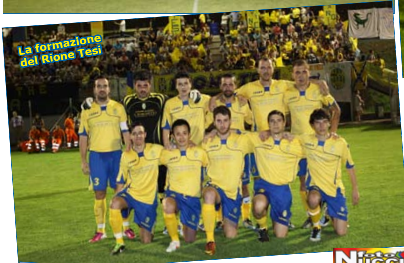
La formazione del Rione Tesi

Le foto del Torneo dei Rioni sono disponibili da Foto Nucci via Verdi n. 29 a Lamporecchio (PT)