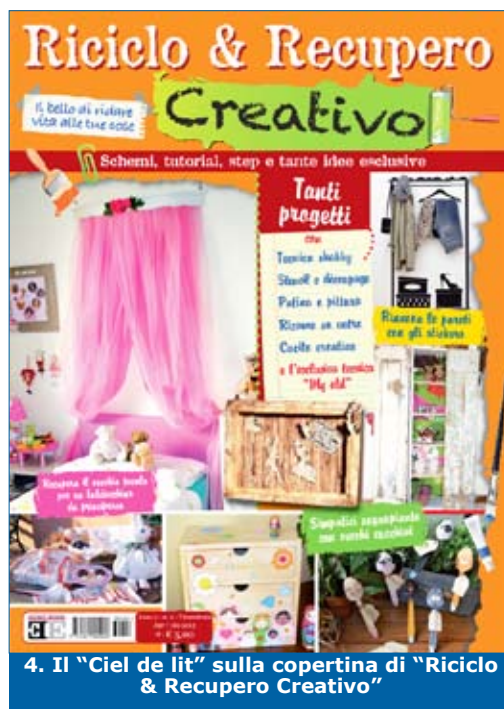
4. Il “Ciel de lit” sulla copertina di “Riciclo & Recupero Creativo”