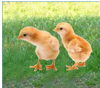
questi sono i miei figli!