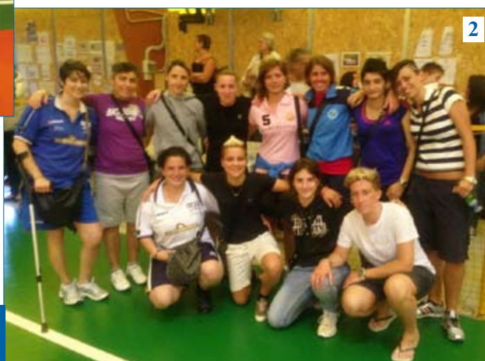
1: Le ragazze della Lampo 1919 dopo la finalissima 2: Pronte per la premiazione 3: L'ambita Coppa Regionale