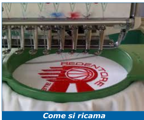
Come si ricama