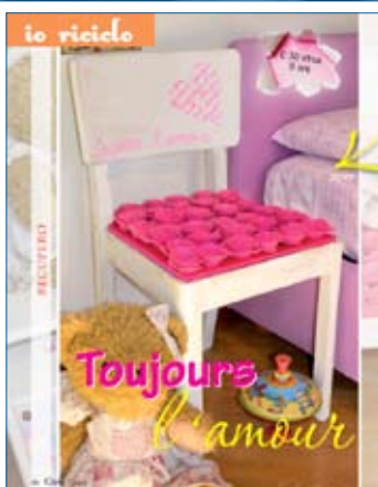
1. La sedia "Toujours amour"

Il recupero è nato un po' per necessità, un po' per gioco: necessità di riutilizzare con