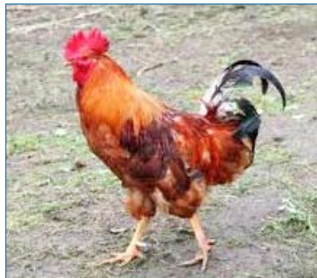
questo è mio marito!