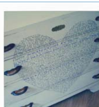
"Cassettoncino dell'Amore", pezzo unico Cassettoncino anni '80 rivisitato 13/06/2007