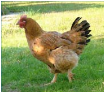
questa sono io!