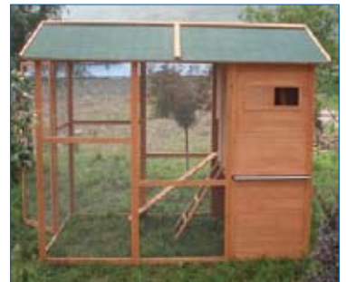
Questa è il pollaio, la mia casa