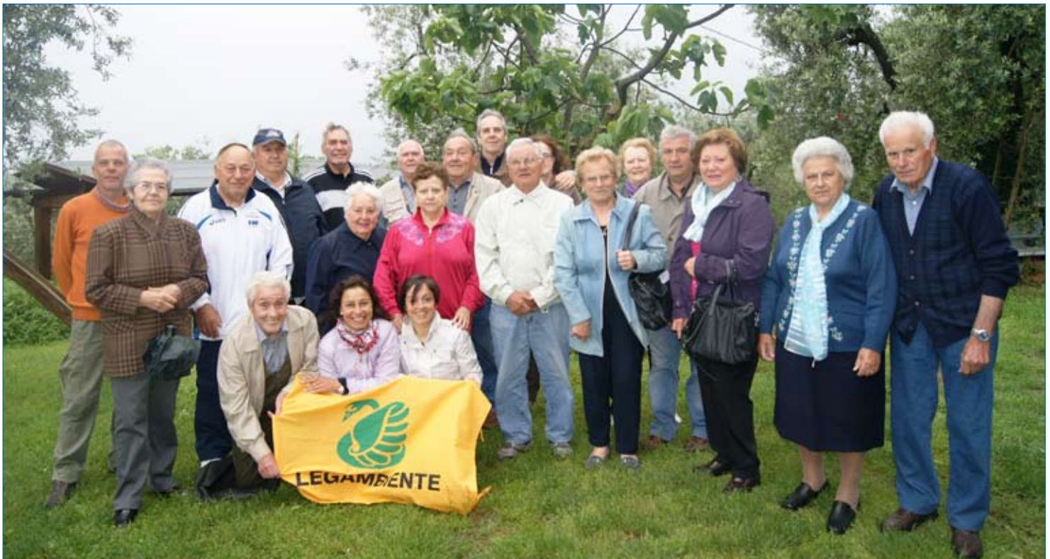
Nella foto sopra il gruppo dei partecipanti al corso "Mangiar bene non ha età"

Si ringrazia per la collaborazione e la disponibilità l'A.P.A. Croce Verde di Lamporecchio e i medici di base dei Comuni di Lamporecchio e Larciano.