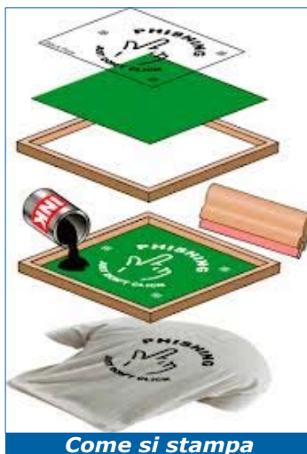
Come si stampa

in grado di ricamare sia pochi pezzi che grossi quantitativi. La realizzazione degli impianti del ricamo la cura nostro padre che da sempre ci dà un grande, grandissimo aiuto!