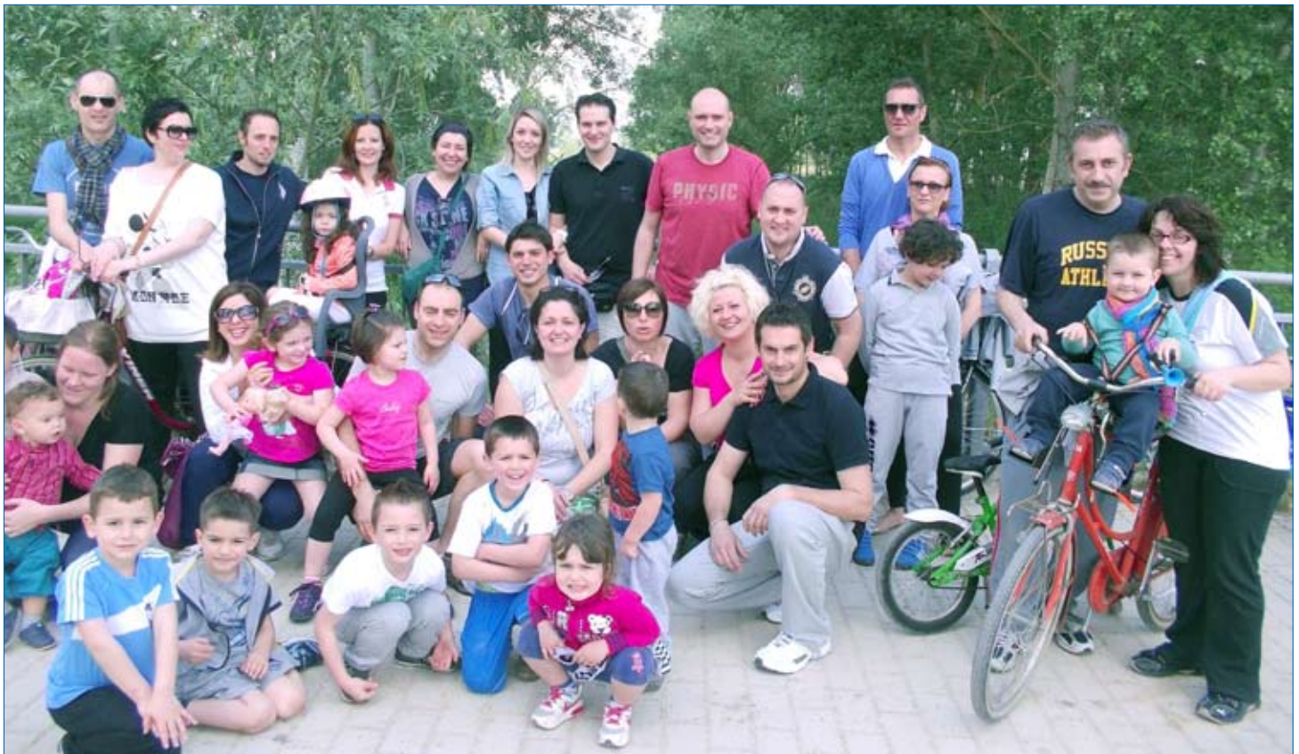
Tutti in bici!!