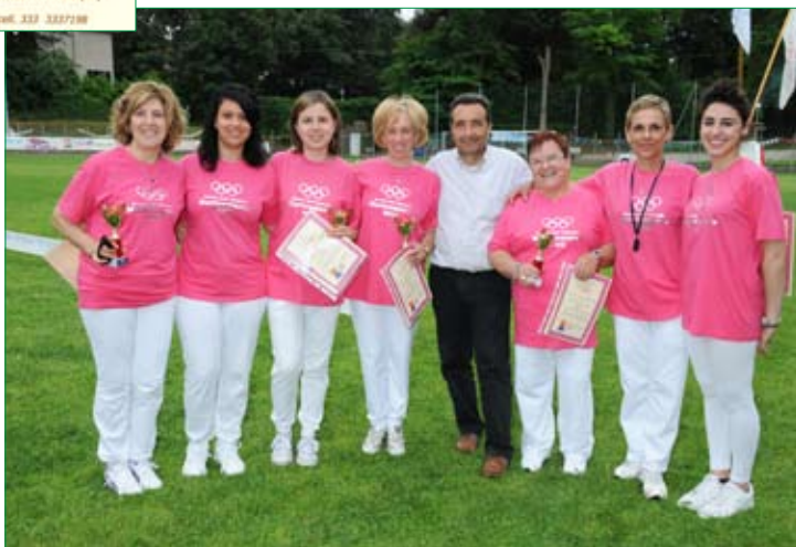
Le insegnanti insieme al sindaco Giuseppe Chiaramonte