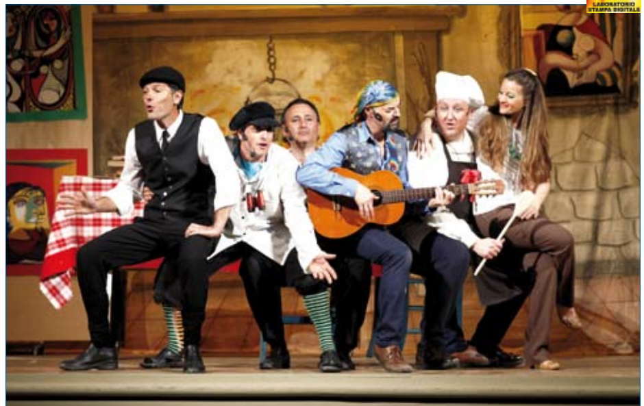
Due scene dello spettacolo "La Principessa e i Latitanti"