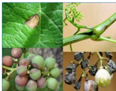
Alcuni esempi di virulenti attacchi di Black Rot