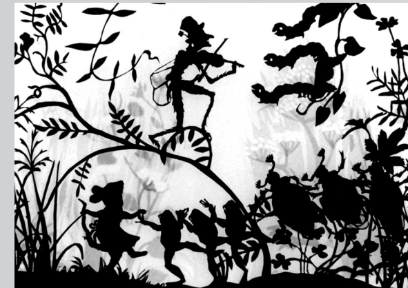
La cicala e la formica