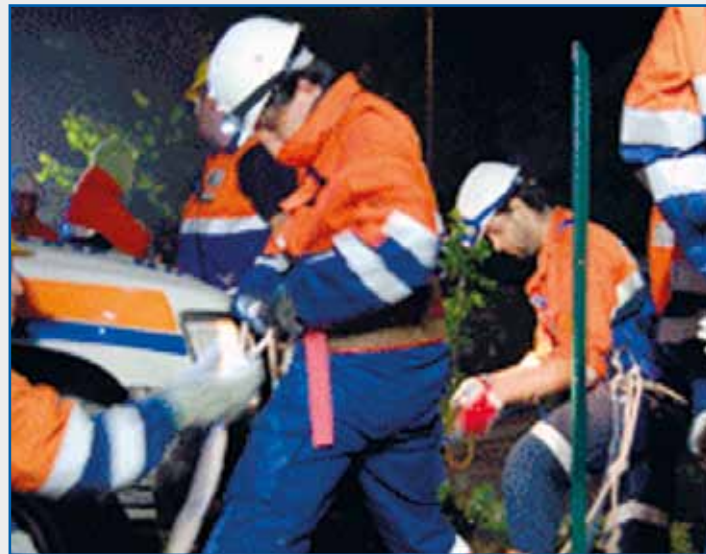
Foto di repertorio interventi Protezione Civile Misericordia di Pistoia

Il Gruppo Protezione Civile della Misericordia di Pistoia ha da sempre preso parte alle operazioni di soccorso alle popolazioni colpite dalle tristemente note calamità naturali e dalle maxiemergenze che si sono abbattute nel nostro paese e all'estero, distinguendosi per professionalità, efficienza, spirito di sacrificio e di carità cristiana. Durante