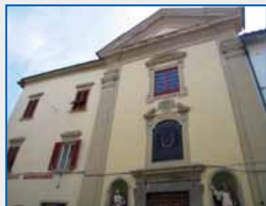
La sede storica della Misericordia di Pistoia in via del Can Bianco, 35

Giornale della Misericordia Istituito nel 1975