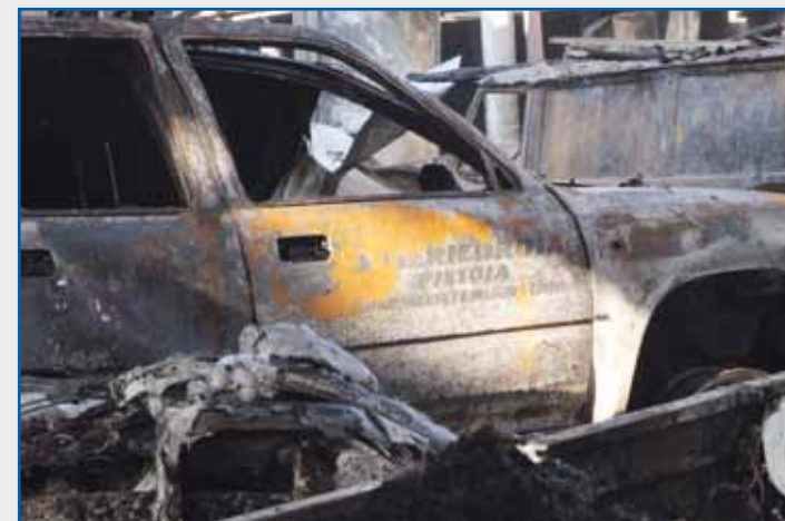
Nelle foto alcune immagini del fabbricato, dei mezzi e delle attrezzature distrutte