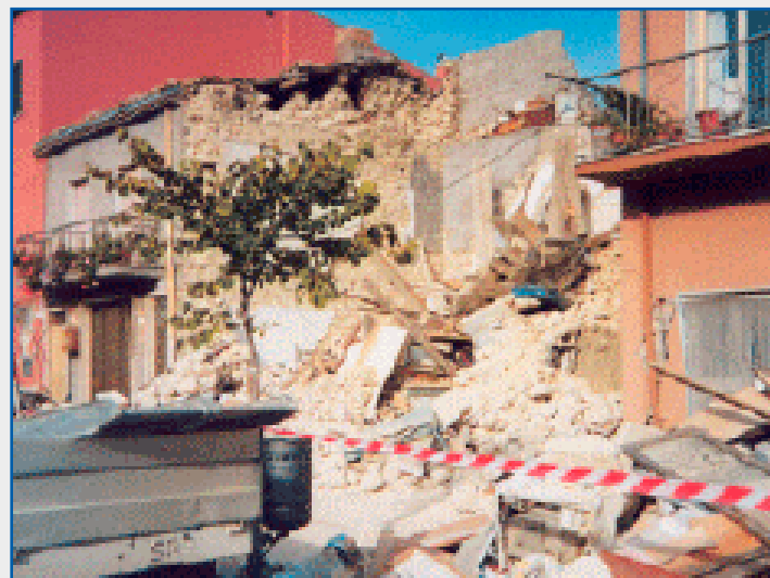
Foto di repertorio interventi Protezione Civile Misericordia di Pistoia

Responsabile del Gruppo Protezione Civile