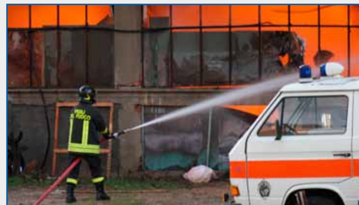
Nelle foto della pagina, alcuni momenti dell'intervento dei Vigili del Fuoco